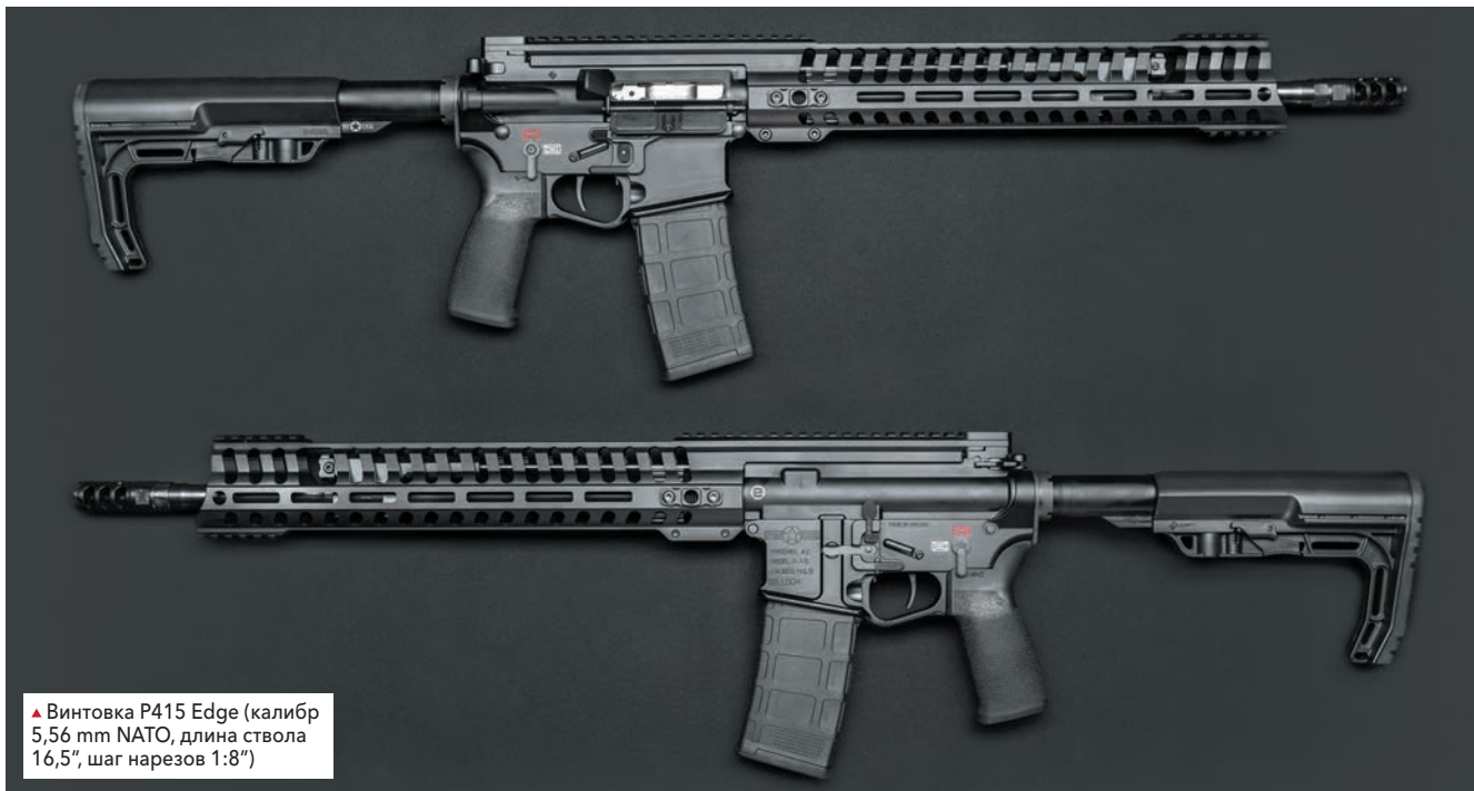
▲ Винтовка P415 Edge (калибр 5,56 mm NATO, длина ствола 16,5", шаг нарезов 1:8")

Более внимательное изучение списка продукции принесло плоды — названия P308 и P415 все же в нем обнаружались, однако со странной приставкой Edge. Для людей моего поколения это слово в первую очередь означает прозвище парня в черной «менингитке», играющего на гитаре и клавишных в знаменитой группе U2, однако тут дело было явно не в рок-музыке, как бы мне того ни хотелось. Дословно же edge в переводе с английского значит — «грань, рубеж». По-видимому, тем самым производитель хотел сказать, что новые модели преодолели некий новый рубеж совершенства, оставив позади предшественников (и тем более конкурентов). Стоит ли говорить, что прихода новых винтовок мы ждали, мягко говоря, с изрядным нетерпением. И вот, наконец, они в Украине.