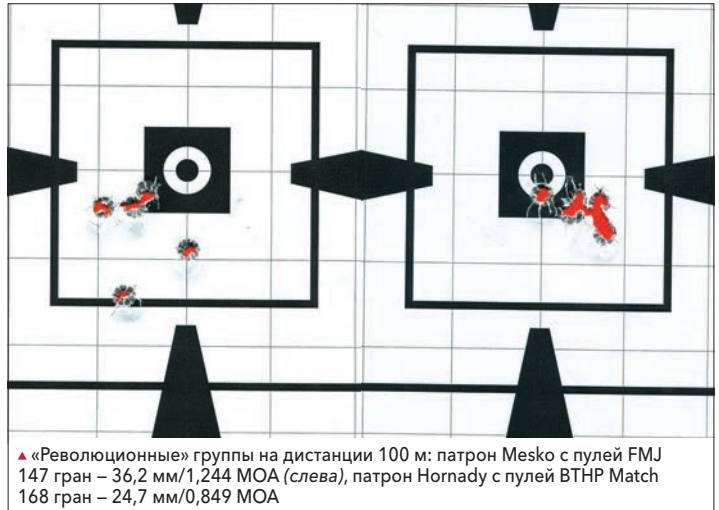
▲ «Революционные» группы на дистанции 100 м: патрон Mesko с пулей FMJ 147 гран – 36,2 мм/1,244 MOA (слева), патрон Hornady с пулей VTHR Match 168 гран – 24,7 мм/0,849 MOA

ками R308 и R415, нам выявить не удалось. А вот поведение Revolution при стрельбе действительно отличается. Основная причина этого, конечно, кроется в сокращении массы и габаритов — полно-размерные версии классической AR-10 при стрельбе контролируются заметно лучше (Revolution же при выстреле изрядно «скачет»), да и попадают слегка точнее. К тому же, они еще и тише — «бройлерный» ДТК новой винтовки никому не даст забыть о себе. Но это, наверное, справедливая плата за выигрыш в массе и размерах, которые дает Revolution. Вы же не думали, что уменьшение кро-кодила до размеров ретривера при полном сохранении изначальных боеспособности и злобы придет совершенно бесплатно? ОСО