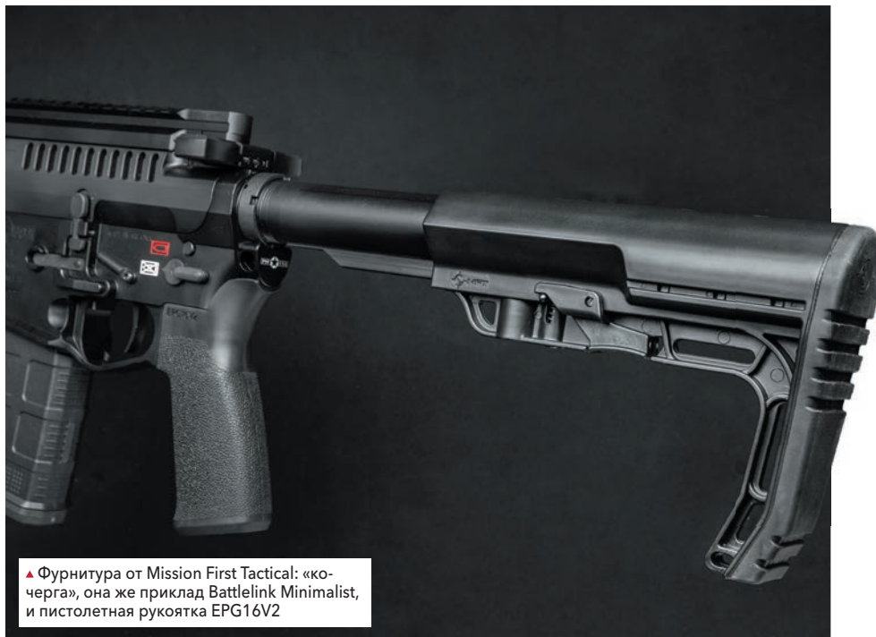
▲ Фурнитура от Mission First Tactical: «кошера», она же приклад Battlelink Minimalist, и пистолетная рукоятка EPG16V2

Приклад MFT Minimalist является таковым в полном смысле этого слова — выглядит он чрезвычайно просто, а то и вовсе примитивно (как писал живой классик — «с претензией на хамство»). Сам производитель заявляет, что это anything but stock, то есть «приклад, а не более того». В привычной нам терминологии это даже не приклад (слово «приклад», думается, означает возможность «приложить» оппонента в случае необходимости), а просто плечевой упор — к заднему торцу перемещаемой по трубе буфера насадки прикреплена широкая пластина затыльника с резиновой накладкой, скошенная в нижней части, а жесткость конструкции обеспечивается Г-образным же узким приливом. В нижней части перемещаемой по трубе насадки предусмотрен подпружиненный фиксатор, контрящий приклад (поскольку магпуловским CTR, да и прочими моделями прикладов для AR-15 вряд ли выйдет полноценно «приложить» кого-нибудь — это вам не СКС и не винтовка Мосина, где приклады как раз на этот случай окованы сталью, — то пусть уж и Minimalist от MFT значится прикладом) в выбранном пользователем положении. В отличие от Magpul CTR, где фиксаторов целых два — один контрит положение приклада, а другой выбирает люфт, превращая конструкцию в жесткий монолит, — у «Минималиста» компенсатора люфтов нет. Для минимизации возможного люфта сама насадка на трубу буфера выполнена, что называется, «в облипочку» — сидит на трубе она настолько плотно, что перемещение ее требует определенного усилия. Из-за необходимости