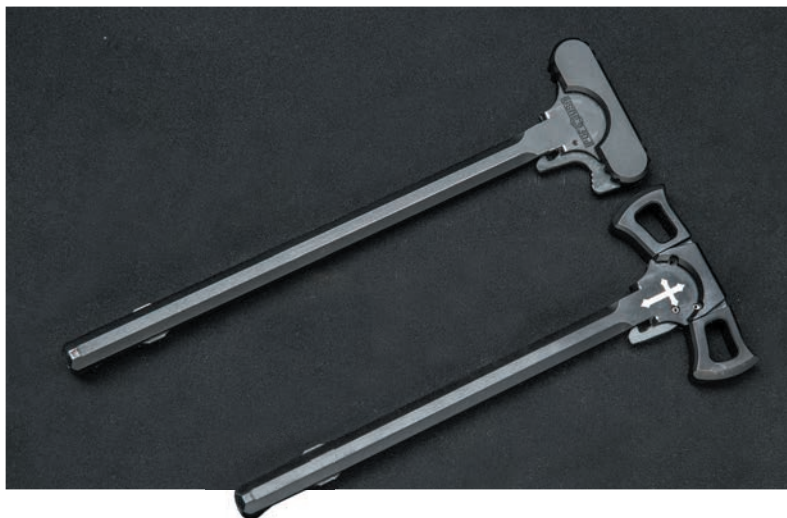
◀ Рукоятки взведения R308 Edge (вверху) и Revolution; христианский крест вместо логотипа производителя, вероятно, символизирует веру в светлое будущее

товки Revolution оба эти элемента теперь выполнены практически зацело.