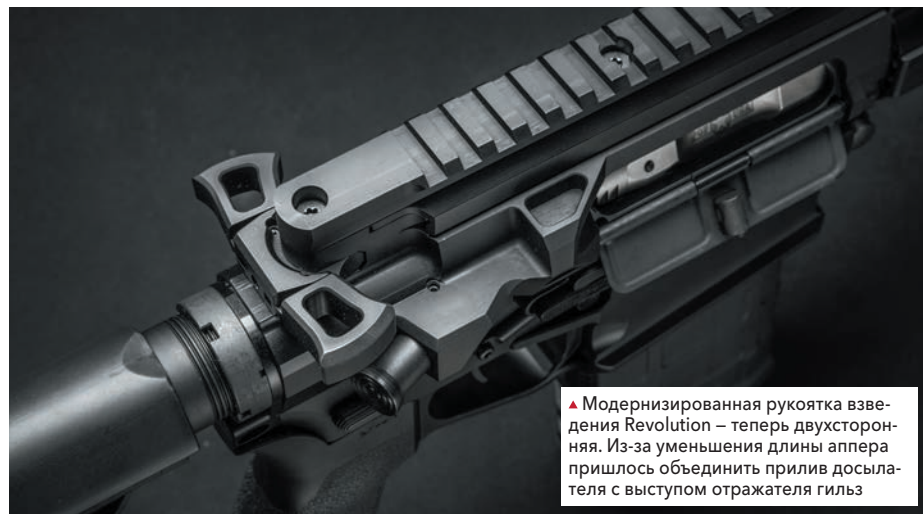
▲ Модернизированная рукоятка взведения Revolution – теперь двухсторонняя. Из-за уменьшения длины апера пришлось объединить прилив досылателя с выступом отражателя гильз