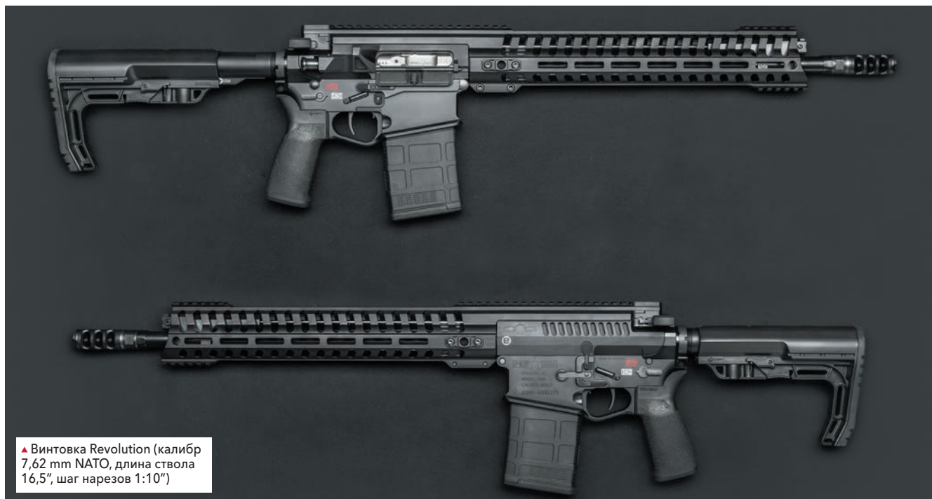
▲ Винтовка Revolution (калибр 7,62 mm NATO, длина ствола 16,5", шаг нарезов 1:10")

выполнено трубчатым и имеет множество облегчающе-вентиляционных вырезов. Теперь, правда, съёмная центральная часть планки Пикатинни на верхней стороне цевья (съёмной она выполнена для облегчения установки оптических прицелов с большим диаметром объектива) уже не входит в комплект поставки, как раньше, и о ее существовании напоминают лишь резьбовые отверстия для соединительных винтов. Таким образом, с верхней стороны цевья остался лишь участок планки Пикатинни длиной пять слотов в его передней оконечности. Аналогичный кусочек планки Пикатинни размещен в передней части цевья винтовок Edge с нижней стороны. Зато новое цевье получило целых четыре гнезда под быстросъёмную антабку, а по бокам и в нижней части у него выполнены прорезы популярного монтажного интерфейса M-LOK от компании Magpul, с помощью которого вы сможете установить на цевье вашей винтовки практически все те же прикрасы, которые раньше могли быть смонтированы лишь на планку Пикатинни.