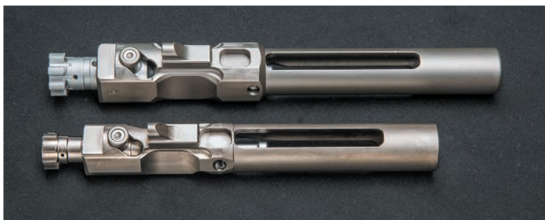
◀ Затворная группа Revolution (внизу), за исключением личинки, в точности соответствует группе R415 Edge — и значительно уступает размерами затворной группе R308 Edge

Revolution есть только одна уплотнительная полимерная вставка вместо обычных двух. Впрочем, гораздо важнее, что органы управления оружием остались прежними и находятся на своих привычных местах. Сохранилось и их двухстороннее размещение — даже выемки для расположения стреляющего пальца никуда не делись. Наглядно, пожалуй, поменялась лишь конфигурация выступа отражателя стреляных гильз и прилива досылателя — их размеры, естественно, остались такими, как это и положено для более крупного из двух калибров, но разместить их пришлось на более коротком участке; поэтому у вин-