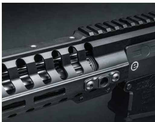
▲ «Похудевшее» цевье винтовок Edge/Revolution с гнездами под антабку; а вот средняя часть планки Пикатинни на верхней стороне цевья теперь в комплект не входит

приложения усилия, кстати, отслеживать промежуточные положения, в которых приклад можно зафиксировать, непросто. И, конечно же, некоторый, пусть и довольно небольшой люфт в зафиксированном положении все же остается — без второго фиксатора его не избежать. Однако все это компенсируется снижением массы — весит MFT Battlelink Minimalist всего лишь 164 г, то есть на 85 г (чуть больше чем в полтора раза) легче, чем Magpul CTR (249 г). Дополнительный, пусть и очень небольшой, выигрыш в массе обеспечивает пистолетная рукоятка MFT EPG16V2 — она на 17 г легче рукоятки Magpul MOE предыдущих модификаций наших винтовок. Капля в море? Не спешите.